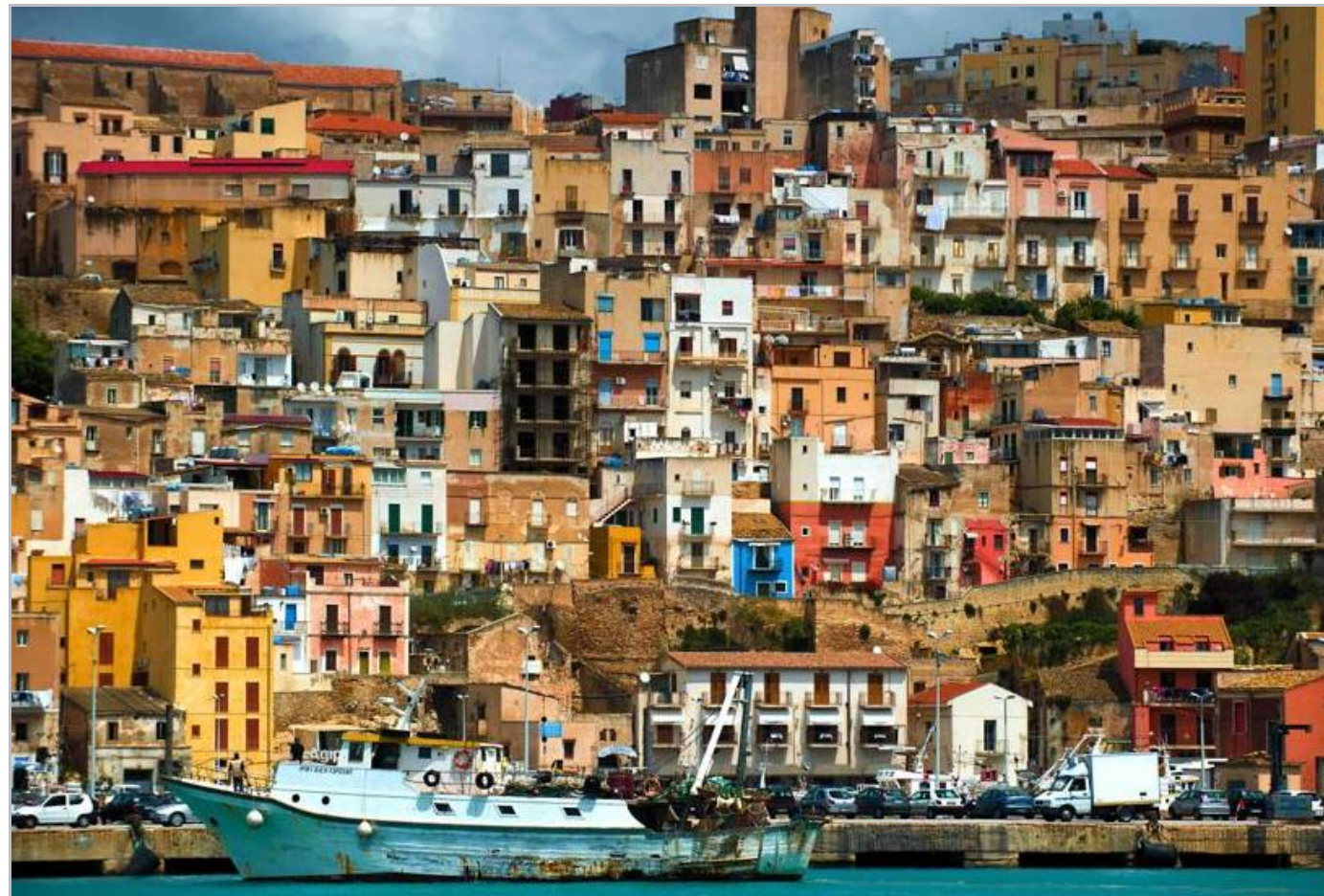
Le port de Sciacca, au sud de la Sicile, symbolise une île aux mille beautés.

Dans le petit port de Sciacca au sud de l'île, un silence presque étrange accompagne l'attente des pêcheurs du large. Alors, un à un, les chalutiers entourés de mouettes et d'oiseaux de mer affamés croisent le vieux phare qui annonce leur retour. Des cris de joie sont lancés par quelques enfants qui rêvent de prendre place un jour dans la flottille. Même les anciens quittent les terrasses des cafés pour venir accueillir les petites embarcations. Tout le monde est là pour emporter au plus vite les poissons, les moules et les crevettes fraîches.